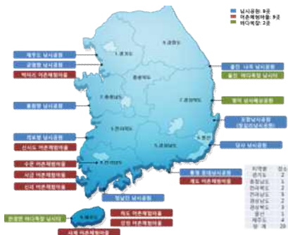
Fig 1 Survey area

바다낚시가 활성화되고 바다낚시인구가 증가하면서 이에 대응하기 위해 국가나 지방자치단체에서 바다낚시공원을 조성하였는데 지금까지 조성된 바다낚시공원은 9개소이며…… (중략) …….