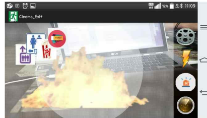
Fig. 4. emergency evacuation App screen

그림 4는 실제 극장에서 스마트폰의 증강현실에서 화재가 발생하여 비상시 탈출 경로를 안내해 주는 앱 화면이다.