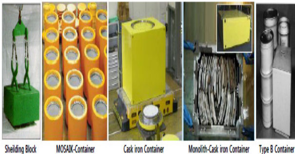
Fig. 3. Recycling Products of Nuclear Industry.

원자력산업계에서 발생하는 방사성폐기물은 재활용(Recycling)을 통해 처리되고 있다. 해외 원자력산업계에서는 방사성 금속폐기물에 대한 무제한 방출(국내의 경우 자체처분)을 위해 많은 노력을 기울여 왔다. 특히 일부 원전 선진국에서는 용융기술을 이용하여 방사성 금속폐기물을 잉곳으로 만들어 보관하거나, 또는 처분 용기(Cask, Container 등)를 만들어 원자력산업계에서 재활용하고 있으나 업사이클링 사례는 전무하다 할 수 있다.