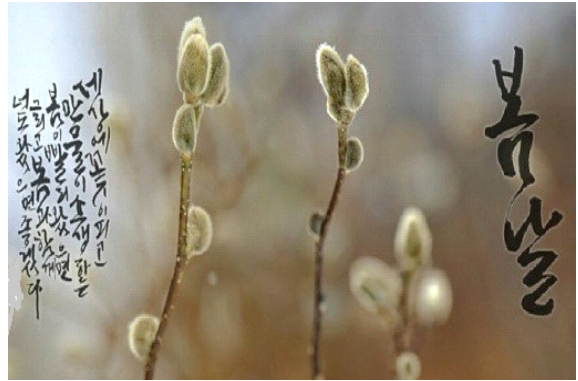
▶▶ 그림 2. 소셜 미디어를 위한 디지털 캘리그래피

[그림 1]과 “무궁화 꽃이 피었습니다.” 라고 캘리그래피로 문자를 마치 붓이 아닌 다른 도구로 정자가 아닌 나뭇가지에 의한 글자체처럼 쓰고, 무궁화 꽃을 연상하는 그림을 한 점 그리고 문자와 이미지에 한국적인 음악을 한국적인 악기 연주로 캘리그래피를 제작하고 제작한 것을 동영상으로 최종 렌더링하여 모바일 기기로 다운로드 하여 소셜 미디어에서 플레이 될 수 있도록 하였다.