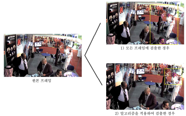
그림 2. 두 검출기에서 얼굴 검출 프레임 비교

알고리즘을 적용하지 않은 경우에는 정지해 있는 물체에도 얼굴이라 검출하였으며 빛이나 화상의 밝기에도 민감하게 반응하여 잘못된 검출을 행했다. 하지만 알고리즘을 적용한 검출기에 경우, T의 크기를 크게 함에 따라 정확도가 달라졌지만 모든 프레임을 검출하는 알고리즘과 비교하였을 때 정확도에는 큰 차이가 없었다. 특히, T값이 2,000일 경우, 두 검출을 비교해 보면 알고리즘이 적용된 검출기가 처리 시간이 약 14배 빠르고 정확도는 2.7 퍼센트 포인트(pp) 낮게 측정되었다. 이에 프레임 처리 시간은 줄어들면서 비교적 대등한 정확도로 검출된 것을 알 수 있다. 하지만 이는 검출된 프레임에 한한 정확도이고 대조군과 비교하였을 경우, 모든 프레임을 적용하는 검출기가 새로운 얼굴에 대한 검출도가 더 높은 것으로 사료된다. 그림 2는 같은 프레임에서 두 검출기를 비교한 것이다. 새로운 얼굴에 대해서 검출 정확도가 다른 것을 확인할 수 있다.