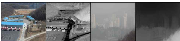
그림 2) 일반 영상과 안개 영상의 빛 전달량 Map

분모의 N은 전체 영상의 면적을 나타낸 것이고 분자는 빛 전달량 t 가 0.1 ~ 0.5인 pixel의 개수를 나타낸 것이다.