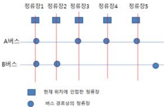
(그림 2) 버스 정류장 인지에 따른 노선 정보 업데이트의 예

이때, 기존에 버스 노선 리스트에 등록되어 있던 노선들에 대해서는 새로 들어온 정류장에 따라서 이 노선의 유효성 여부를 판단한다. 임의의 기존 등록된 하나의 노선이 현재 정류장 위치를 알고 있다고 하자. 이 때, 새로 들어온 정류장들 중의 하나라도 이 노선의 다음 정류장과 일치한다면, 해당 노선의 pass count를 1 증가시키고 새로 들어온 해당 정류장을 그 노선의 현재 정류장으로 변경한다. 예를 들어 그림 2에서와 같이 임의의 사용자의 위치정보에 따라 정류장 1부터 정류장 5까지의 정보가 연속적으로 획득되었을 경우를 생각해보자. 정류장 2번이 검색될 때, A 버스의 경우엔 현재 정류장이 정류장 1이고 다음 정류장이 정류장 3이므로 pass count가 증가 하지 않고, B 버스의 pass count가 증가한다. 이런 방식으로 정류장 5번까지 정보를 획득한 후 살펴보면 A 버스의 pass count는 4, B 버스의 pass count는 2가 된다.