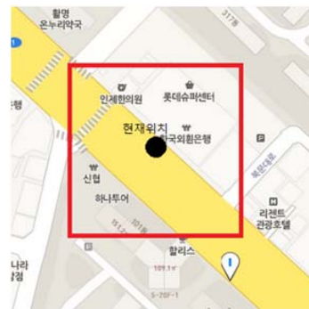
(그림 1) 사용자 위치에 따른 정류장 검색 범위의 예