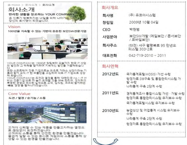
(그림 5) 모바일 페이지 자동 생성

(그림 4)와 같이 분할된 페이지 레이아웃을 기반으로 (그림 5)와 같이 모바일 페이지가 자동으로 생성된 것을 확인할 수 있다. 태블릿 및 모바일 페이지 내에서 레이아웃별 숨기기/표시 및 크기 조정이 가능하며, 레이아웃 내 컴포넌트별 크기 및 위치 조정, 숨기기/표시, 텍스트 편집 기능을 제공한다.