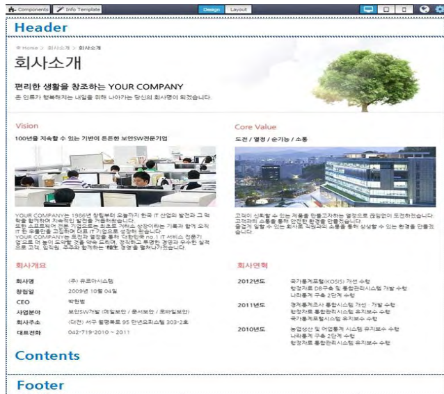
(그림 3) 페이지 레이아웃 및 UI 설계

3.1절의 사항 등을 고려하여 페이지 레이아웃을 (그림 3)과 같이 Header, Contents, Footer 영역으로 구분하였다. 각각의 영역에 UI 컴포넌트를 자유롭게 추가 및 이동이 가능하며, 컴포넌트별 크기 조정 및 스타일 속성을 지정할 수 있다. 위와 같은 기능을 별도의 HTML5 및 CSS 코딩 없이 직관적인 WYSIWYG(Drag & Drop) 기반으로 제공한다.