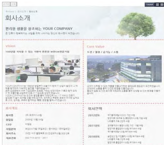
(그림 4) 페이지 레이아웃 분할

(그림 3)과 같이 UI 설계가 완료된 페이지에 대해 (그림 4)와 같이 사용자에게 직관적인 페이지 레이아웃 분할 기능을 제공한다. 상단의 가로 또는 세로 분할 가이드 선을 이용하여 사용자가 구분할 콘텐츠 영역 위치에서 페이지 레이아웃을 분할한다. 분할된 페이지 레이아웃을 개별적으로 선택하여 삭제할 수 있으며, 분할된 레이아웃을 초기화하여 다시 설정 할 수 있는 기능을 제공한다.