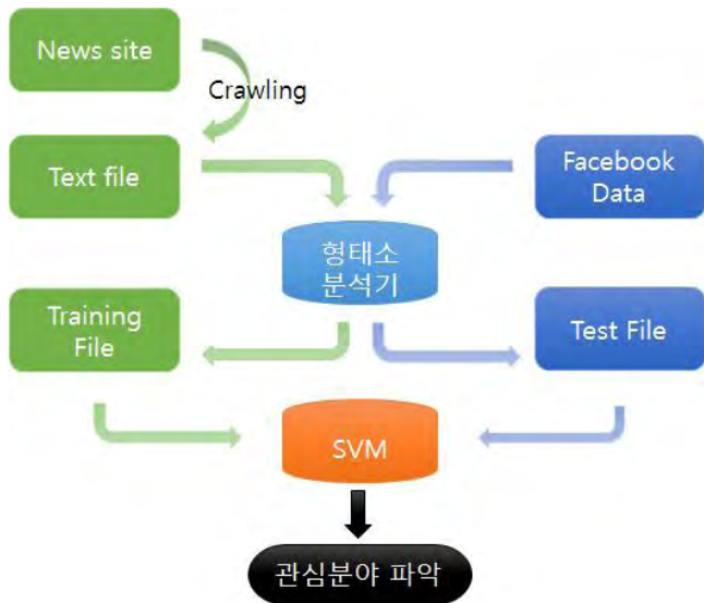
(그림 1) 소셜 데이터와 텍스트 분류 기술을 이용한 관심 분야 파악 시스템