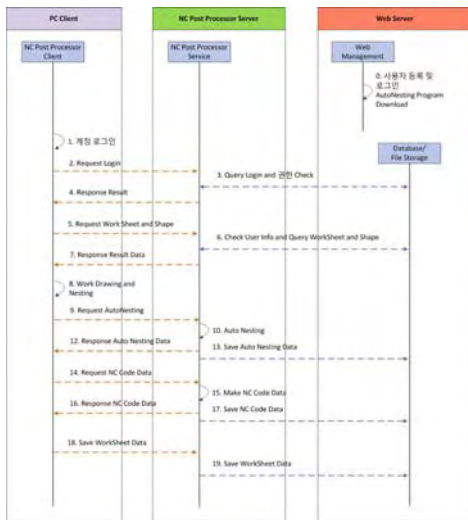
(그림 3) 서비스 시나리오

부재 절단 CAM 공정에서 생성된 공구경로데이터를 ASCII 코드 형태로 입력받아 각 레코드의 주언어 내용을 검색하고 해석하여 관련 기능을 수행할 수 있도록 세부 모듈단위로 구분하였다.