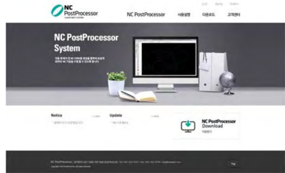
(그림 4) 서비스 중인 웹사이트 예

템 서버 측에서 권한을 체크한 후 사용을 허락한다. 사용자는 워크시트와 부재 정보를 입력하고 작업을 명령하면 “Work Drawing and Nesting”, “Make NC Code Data”, “Save WorkSheet Data” 등의 작업이 수행된다. 이들 작업은 클라우드서비스를 지원하는 웹서버와 PC 클라이언트 그리고 NC 포스트프로세서 서버 간에 메시지 교환을 통해 이루어지며 결과물을 파일로 저장되어 다운 받을 수 있도록 되어있다.