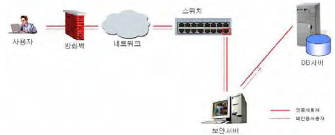
(그림 2) Gateway 방식을 사용한 접근제어