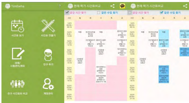
(그림 1) 메인 화면, 공강 시간 비교화면, 같은 수업 비교화면

본 논문에서 개발하는 공유형 시간표 관리 시스템의 소프트웨어 기능 명세는 다음과 같다. (그림 1)과 같이 앱의 주요기능으로는 시간표 보기, 시간표 만들기, 과제/시험 관리, 메모, 친구추가, 친구 시간표와 비교, 계정관리가 있다.