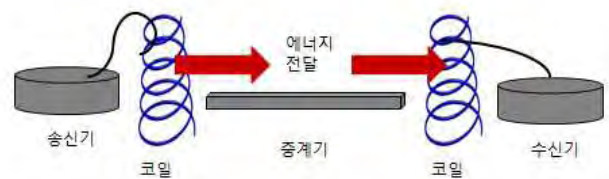
(그림2) 무선충전의 원리

제안하는 시나리오는 BLE의 기술을 탑재하고 있는 단말 기기를 통해서 사용자가 블루투스의 기능을 실행하고 BLE 무선 전력 송신기기와의 상호 연결을 설정하게 되면, 송신기기의 코일에서 마그네틱 필드를 유도하여 무선 전력을 보내고, 사용자의 송신기기가 전력을 유도 받는 방법으로 충전이 이루어지게 하는 것이다. 이러한 방법은 와이파와 유사한 대역을 사용하여 안정성이 있고, 블루투스를 실행 시켜 놓는다고 하더라도, BLE기반의 무선전력 송신기를 유선전력에 연결 시켜 놓는다는 가정 하 이기 때문에, 블루투스 실행의 전력소모량 보다 사용자의 이동 단말기기에 공급되어 질 수 있는 전력 송신량이 더 많이 제공되어 질 수 있으므로 기기의 무선 충전 시나리오가 가능하게 된다.