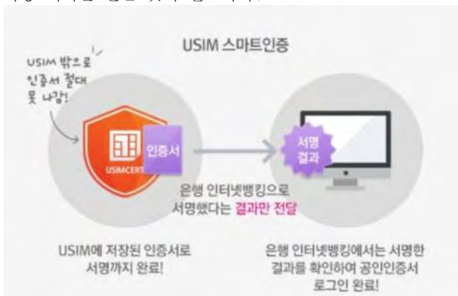
(그림 8) USIM 스마트인증

따라서 각 서비스 마다 아이디와 패스워드를 별도로 관리 하는 것이 아니라 안전하고 별도의 분리된 어플라이언스 상에 보안토큰(HRS)을 보관하고 다중인증 방식을 통해서 허가 받은 사용자인지 확인 후 해당 클라우드 서비스에 사용 허가를 받는 것이 필요하다.