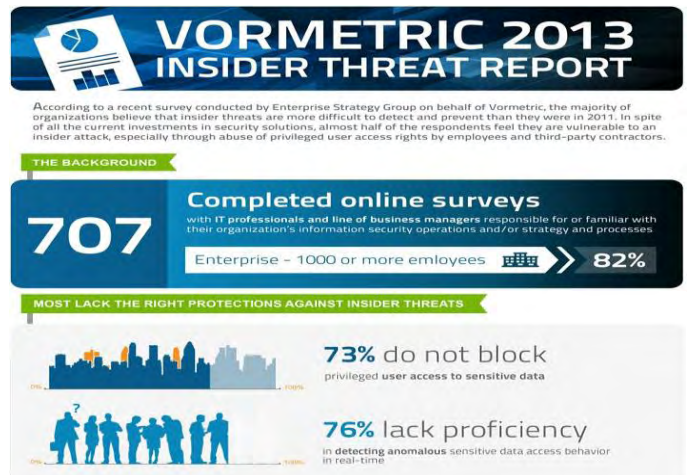
(그림 1) 2014 보메트릭 내부자 위협 보고서

2014 보메트릭 내부자 위협 보고서에 따르면, 이러한 내부 위협 요소의 2/3 가 IT 관리자 계정 및 특정 권한 계정과 관련이 있으며, 또한 내부 네트워크에서 임무를 수행하는 협력업체 인력의 계정과도 관련이 있다고 확인 되었다.