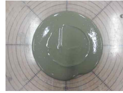
그림 1. 테이블플로

초미분 고로슬래그를 사용하였다. 시험방법으로 테이블플로는 KS L 5111의 의거하여 시험을 실시하였으며, 레올로지 시험과 비교를 위해 무타격으로 실시하였다. 레올로지 시험은 Brookfield사의 R/S Solids 타입의 레오미터를 사용하였고, 스피ndl들은 가로×세로의 비가 30×60mm의 베인스핀들을 사용하였으며, 레올로지 정수를 측정하기 위한 전단변형속도는 0.1~10/s 범위로 설정하였다.