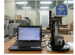
그림 2. 레오미터 시험