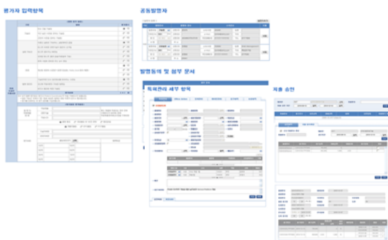
그림 2. 서브 시스템 구현 예 Fig. 2. Sub System Examples

메인화면은 로그인 프레임과 각종 공고, 게시판 및 지적 재산권 관리 관련 각종 웹 사이트 및 기관 직접가기 아이콘으로 구성되어 있다.