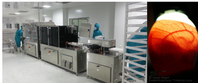
(그림 1) 검란기계와 불빛을 이용한 직접관찰

세계 계란 생산량은 1980년대부터 꾸준히 증가하여 현재 6,284만톤 수준이다. 나라별 생산량으로는 중국, 미국, 인도, 일본, 멕시코 순이며 한국은 56만 6천톤으로 세계 22위 생산국이다. 국내 유행을 기반으로 한 인플루엔자 백신 제조업체는 독심자와 일양약품이 있으며, 각각 연간 2,000만 dose, 6,000만 dose가 생산이 가능하다. 유행 당 약 1 dose가 생산되므로, 인플루엔자 백신에 사용되는 유행은 연간 약 8,000만개로 예상할 수 있다. 백신용 유행 또는 부화장과 양계업계에서는 유행의 검란 (Candling)이 필수적인 공정 또는 과정 중 하나이다. 현재 검란의 방식을 살펴보면 직접 빛을 하나하나 유행에 비추어 직접 관찰하는 방법과 검란기 (Candling machine)를 사용하는 방법 등이 있다(그림 1).