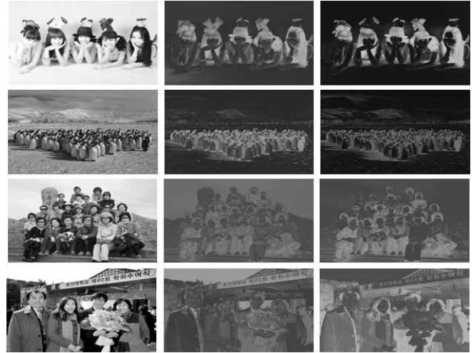
그림 3. saliency map의 비교. (a) 원영상, (b) HBC [1], 및 (c) 제안방법

실험에서는 FHD 해상도의 영상을 실험하였다. 제안 방법의 성능을 검증하기 위해서 배경영역이 존재하는 영상을 선택하였다. 그림 3은 (a)는 원영상, (b)는 [1]의 histogram based contrast로부터 얻어진 saliency map, 그리고 (c)는 제안방법으로 얻어진 saliency map이다. 배경 영역은 주로 top 영역이다. (b)의 배경보다는 (c)의 배경의 값이 상대적으로 낮은 것을 알 수 있다.