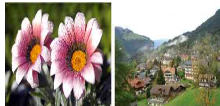
그림 1. 배경이 존재하는 영상의 예들

일반적으로 영상은 배경과 전경으로 분리된다. cluttered environment에서는 배경영역을 찾는 것은 쉽지 않지만, 본 논문에서는 배경이 존재하는 영상을 대상으로 한다. 그림 1은 실험영상의 예들을 보여준다. 또한 배경은 그림 2처럼 위, 좌, 우에 존재한다고 가정한다.