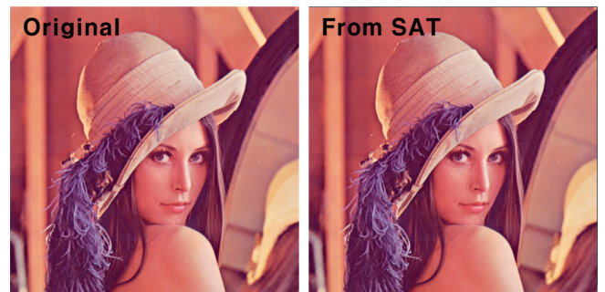
그림 3. 원본 이미지와 합산 영역 테이블을 이용하여 복원한 이미지

정밀도 오차를 측정하기 위해, 원본 이미지와 합산 영역 테이블을 이용하여 복원한 이미지를 비교하였다 (그림 3). 측정 오차는 PSNR, SSIM[3]의 두 대표적 방법을 이용하여 측정되었다. 복원 결과의 오차는 매우 작으며, 특히 SSIM은 1에 매우 가까움을 알 수 있다.