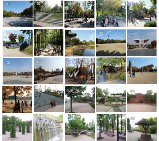
Figure 1 Pictures of selected locations

도심 사운드스케이프를 평가하기 위해 현장 설문 조사와 음환경 측정을 실시하였다. 설문조사는 2012년 가을에 이루어졌고, 서울지역에 위치한 대표적인 도심 공원으로 서울숲 9개소, 올림픽 공원 8개소, 선유도 8개소 지점을 선정하였다. Figure 1은 각 공원의 풍경 모습이다.