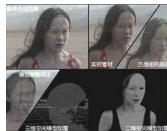
▶▶ 그림 1. 얼굴에 서리가 쌓이는 특수효과

얼굴에 서리가 점차적으로 내리는 효과를 통해서 영화 인물의 내심에서 서서히 죽음을 접근하는 느낌을 표현한