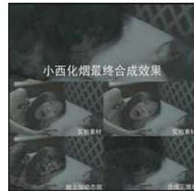
▶▶ 그림 4. 인물이 한 줄기의 짙은 연기로 되는 특수효과

낌을 표현하였다. 이것이 죽어가는 느낌이고 영혼은 소실하는 느낌이다. 전체 장면은 슬픔으로 가득 차 있다. 고인과 더 이상 만날 수 없는 절망의 기분을 표현하였다. 현실 세계에서 고인이 점차 소실되는 두려운 기분을 표현하였다. 죽은 자를 만류할 수 없는 절망의 기분과 유일한 친구와 음양 세계로 갈라지는 비할 바 없는 아픔을 표현하였다. 고인의 몸에서 짙은 반점이 점진적으로 나타나면서 얼굴이 더 무서워지고 나중에는 한 줄기의 짙은 연기가 되는 것으로 고인이 죽음을 당할 때의 원한과 억울한 심정을 표현하였다.