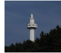
Fig. 2 Daejin Light House