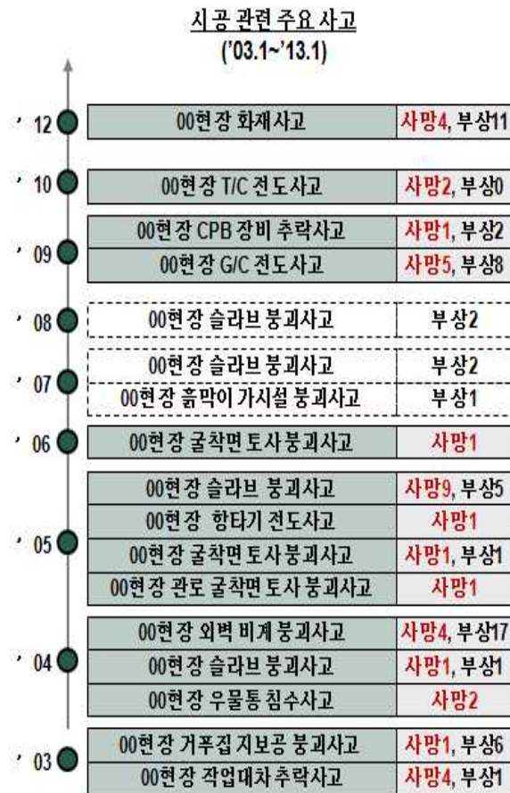
<그림 4> C사의 최근 10년간 발생한 대형 중대재해

C사에서는 유난히도 타 건설사 대비 대형 중대재해가 많이 발생하였으며, 그 결과 수많은 인적손실 및 물적 손실을 가져왔다. 그때마다 회사의 대외적 이미지는 실추되었고, 직원들의 사기도 저하되었다. 사고 후 경영층의 적극적인 의지로 신규 안전대책