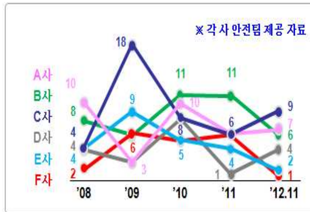
<그림 1> 최근 5년간 6대 건설사 사망자수

국내 6대 대형건설사를 기준으로 2008년도부터 2012년도까지 안전사고로 인한 근로자 사망자 수를 <그림 1>을 참조하여 분석해보면, A사 36명, B사 44명, C사 45명, D사 20명, E사 24명, F사 20명 등 5년 동안 총 189명으로 각 건설사별 1년에 약 6명의 근로자가 생명을 잃었으며, 년도 별로 분석해보면 2008년 32명, 2009년 42명, 2010년 47명, 2011년 34명, 2012년 29명으로 매년 각 건설사별 수많은 안전지침, 우수한 시설물, 신규 안전조직, SMART 및 IT System 적용 등 안전사고 예방관련 투자 및 적극적인 활동에도 불구하고, 안전사고로 인한 사망자수는 결코 줄어들지 않고 있다는 걸 알 수 있다. 그렇다면, 이렇게 발생하는 안전사고가 회사에 미치는 영향을 재해손실비