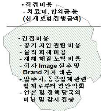
<그림 2> 버드의 병산의 이론 - 재해손실비용

용으로 산출하여 살펴보도록 하자. 하인리히(1926년)는 재해로 인해 발생하는 간접손실비용은 직접손실비용의 4배가 된다는 1:4 이론을 발표하였고, <그림 2>와 같이 버드(1961년)는 병산의 이론을 바탕으로 간접 손실비용은 직접 손실비용의 5배 까지 발생한다고 하인리히의 이론 보다 더 많은 간접손실비용을 주장한 바 있다.