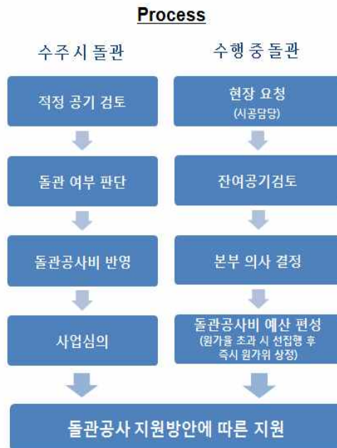
<그림 5> 돌관공사 지원 PROCESS

C사에서는 사업본부별 돌관공사를 정의하였고, 현재 진행 중인 돌관공사 현장을 확인하였다. 그렇다면 지금부터 수주 시 돌관공사 현장과 수행 중 돌관공사 현장을 구분하여 해당 현장을 어떻게 지원해야하는지를 검토해보도록 하자. <그림 5>에서 처럼 일단 Process부터 정립을 하였다. 수주 시 돌관공사의 경우는 건축CE팀과 해당사업본부 CM팀 및 스케줄팀에서 적정 공기를 검토하고, 돌관여부를 판단해서 돌관 공사비를 반영하여 이를 사업심의 위원회를 통해 받는 방법이었고, 수행 중 돌관 공사의 경우는 현장에서 시공담당임원에게 요청을 하고, 잔여공기를 검토 받아 각 사업본부장의 의사결정으로 돌관 공사비 예산을 편성하기로 하였다. 물론 원가율 초과 시는 선 집행 후 즉시 원가위원회에 상정하는 방법이었다. 이렇게 두 가지로 구분하여 지금부터 구체적인 무엇을 지원해야 하는지, 어떤 방법으로 지원을 해야 근본적으로 도움이 되어 문제를 해결 할 수 있는지를 찾아보도록 하자.