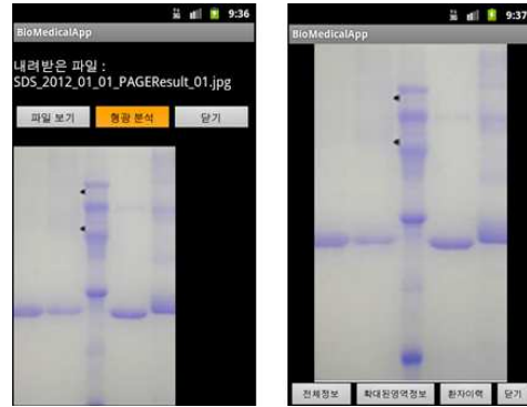
그림 3. 다운로드한 데이터에 대한 형광분석

다. 이러한 정보를 통해 사용자는 형광 이미지의 변화 상태를 파악할 수 있다.