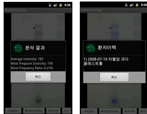
그림 4. 형광 이미지 분석과 추가 정보

그 외 전체 픽셀 값에 대한 빈도수와 비율 계산 정보들은 파일로 저장하게 하였다. 추후 히스토그램으로 구현할 예정이다. 형광 이미지들에 대한 추가 정보들, 예를 들면, 형광 이미지를 찍은 환자의 이력이나 현재 주의 사항에 대한 정보도 형광 이미지와 함께 서버로부터 다운로드하여 그림 4 (b)와 같이 보여 줌으로 형광이미지 분석에 추가적인 도움을 주도록 하였다.