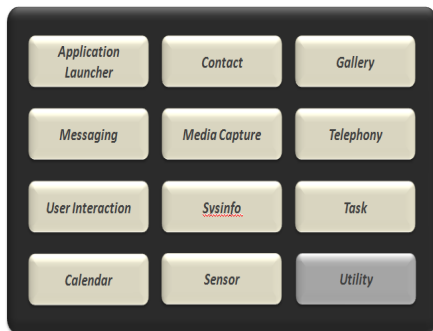
그림3. HyWAI 제공 API

현재 HyWAI 엔진을 통해 제공되는 주요 API들을 그림3과 같다. HyWAI API의 주요구성은 W3C DAP WG과 WAC에서 표준화가 이루어지고 있는 API들을 기준으로 구성하였다.