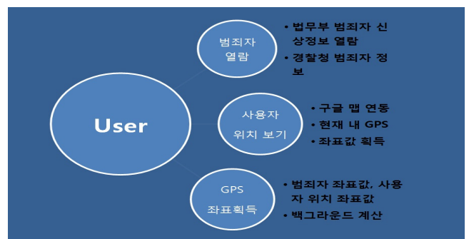
<그림 1> Application 설계단계 기획안

실시간으로 사용자의 GPS 신호를 통한 사용자 위치추적과, 범죄자의 위치정보 파악후 모든 작업은 백그라운드에서 이루어지고, 사용자의 선택에 따라 알림, 진동, 블루투스 등의 방법으로 위험을 알리게 된다.