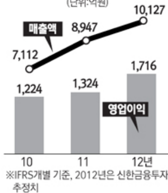
[표 3] CJ오쇼핑 실적추이 (단위:억원)

특히, CJ오쇼핑의 소셜커머스 서비스인 '오클락(O'clock)'은 모바일에서 인기 판매 상품 순위를 15분 단위로 업데이트해 보여주는 '오클락 실시간 랭킹 서비스'를 제공하고 있다. 식품이나 액세서리 등 가격부담 없이 쉽게 살 수 있는 상품들이 인기다. 이러한 오클락의 인기에 힘입어 지난해 하반기 CJ오쇼핑의 모바일 매출은 상반기에 비해 7배 이상 늘었다. 3)