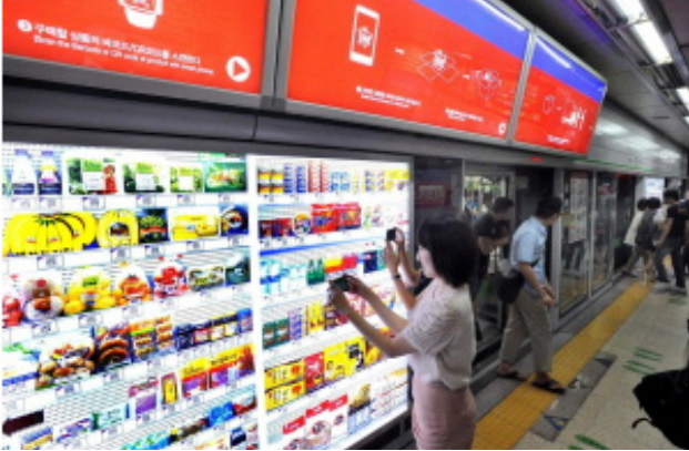
[그림2] 지하철역 안에 가상스토어

홈플러스의 가상스토어는 고객이 상품의 바코드나 QR코드를 홈플러스 스마트앱으로 촬영해 언제 어디서나 오프라인 매장에서 쇼핑하듯 직접 상품을 보며 쇼핑할 수 있게 한 서비스. 매장이다. 5)