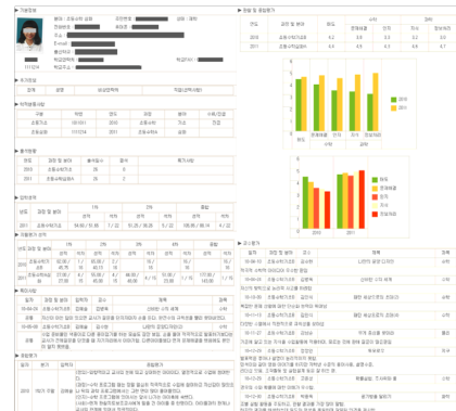
그림 2. 학생 관리 데이터베이스 예시 Fig. 2. An Example of Students Management Database

학생들에 대한 관찰 사항과 체크리스트, 평가결과 등의 종합관찰 기록, 강의를 담당한 교수(강사)가 관찰한 특별한 학생들의 관찰평가, 분기별 지필 평가 자료, 학생들의 산출물, 교육프로그램 평가 및 설문, 활동 장면 등의 사진자료를 포함한다. 물론 관리 시스템 우수 사례로 발표되었으나 그 기관 내에서 학생의 재선발이나 추천서 작성, 학부모와의 상담, 영재교육 연구의 기초자료 중심으로 활용되고 있는 수준이며, 학생의 지속적인 관리를 통한 자아실현까지 관련하고 있지 않다는 측면은 반드시 고려되어야 한다.