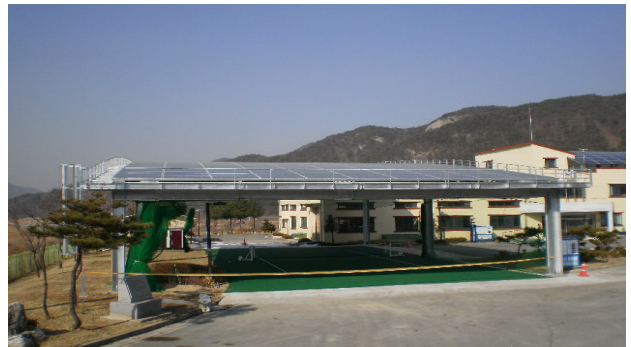
<그림 2> 태양광 발전설비 설치 사진