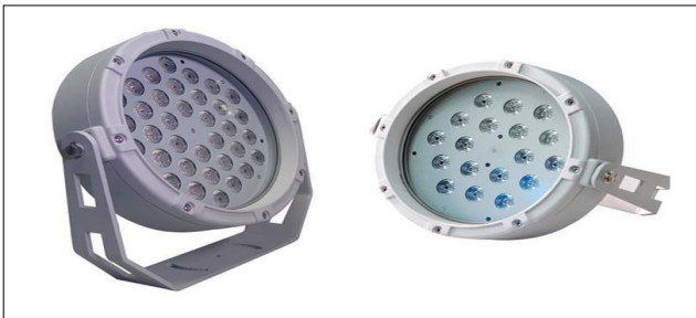
〈그림 5〉 LED 조명설비