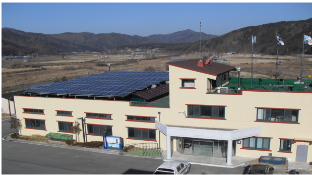
<그림 1> 속리산하수처리장 전경

속리산하수처리장 전력설비는 계약전력 150 kW, 수전전압 22.9 kV로 1회선 수전방식으로 비상발전기 400 kW 1대 설치되어 있으며 주요 전력설비는 송풍기, 반송펌프, 교반기, 탈수기 등으로 구성되어 있다.