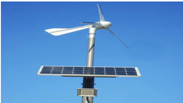
〈그림 4〉 풍력태양광 가로등설비