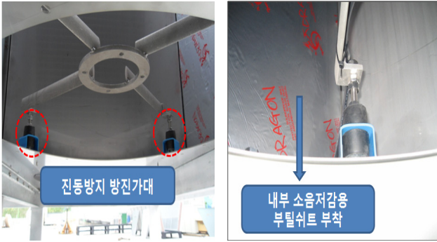
〈그림 4〉 지시대 방진 및 부틸 시트 적용