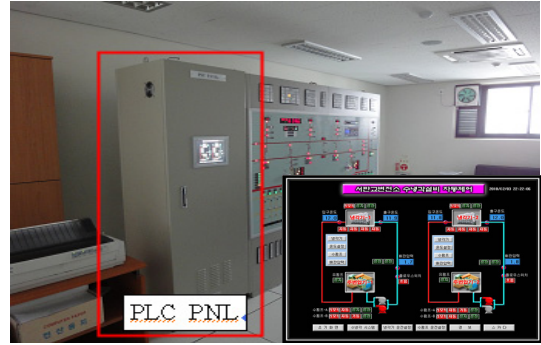
〈그림 7〉 자동제어 시스템 현장제어반 및 터치스크린