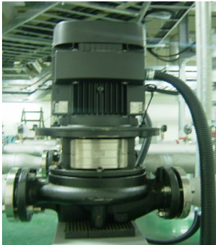
〈그림 5〉 순환펌프

냉각수 순환펌프의 설계는 냉각공기의 입출구 온도차를 높임과 이와 더불어 변압기 열교환기의 성능에 영향을 미치지 않는 조건에서 냉각수 입출구 온도차를 초기 설계시 5℃에서 7℃로 올려 유량을 낮추고, 배관 압력 저하효과에 따라 배관의 손실양정이 줄어들게 되어 냉각수 순환펌프의 용량을 줄임으로써 펌프동력을 15kW에서 5.5kW로 줄일 수 있게 되었다. 이로 인해 설비 건설비용 및 운전비용의 절감효과도 얻었다.