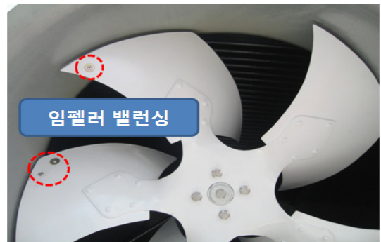
<그림 3> 저소음 냉각팬

우리나라의 주거지역 생활소음 규제기준인 주간 55dBA, 야간 45dBA 이하를 만족시키기 위해서 단상 BLDC(Brushless Direct-Current Motors) 적용 및 팬 임펠러 정밀 밸런싱 등을 적용한 저소음 냉각팬을 개발하였다.