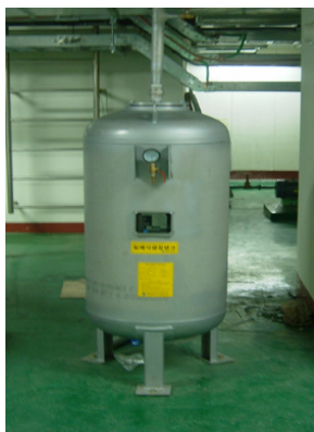
〈그림 6〉 벨로우즈

벨로우즈는 냉각시스템이 밀폐사이클이기 때문에 밀폐형 팽창탱크를 사용하고, 배관 내 냉각수량과 냉각수의 최저(5도), 최고(55도) 수온을 고려하여 탱크 용량과 압력을 결정하였다. 팽창탱크의 용량은 300리터이며, 사용압력은 2.8kg/cm 2 ~ 4.5kg/cm 2 이다. 또한 보충수에 감압변을 설치하여 보충수의 압력이 2.8kg/cm 2 가 유지되도록 하였다.