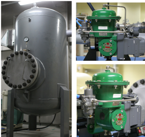
Fig. 2 a) High Pressure Reservoir Tank b) Control Valve

나 고압 탱크의 관리 및 설치 공간에 제약이 있으므로 본 연구에서는 Fig. 2의 (a)와 같이 40 kg/cm 2 의 공기를 저장할 수 있는 3 m 3 의 공기 탱크를 제작·설치하였다. 탱크에 압축 공기를 공급하기 위한 압축기는 코더엔지니어링에서 제작한 3단 압축기인 LT-2116X 모델을 사용하였으며 저장 탱크에 40 kg/cm 2 의 공기를 충전하기 위해 약 4시간 정도 소요된다.