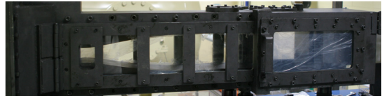
Fig. 4 Nozzle & Test Section

Figure 3 에 나타난 바와 같이 높이가 일정한 상태에서 길이만 증가시키는 경우 경계층 성장으로 인하여 경사 충격파가 발생하고 출구 마하수가 감소하게 된다. 이에 본 연구에서는 주 시험부 유동의 교란을 최소화하기 위하여 시험부의 길이를 높이의 1.2배만큼 증가시킨 형태로 노즐을 제작하였다.