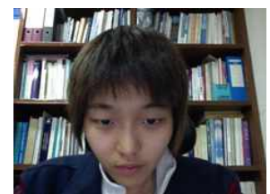
(바) (마)의 카메라시점 영상

그림 1. 컴퓨터를 사용하는 사용자의 여러 가지 자세와 정면 시점 영상. (가)(다)(마)의 노란색 원은 카메라가 위치한 곳을 가리킨다.