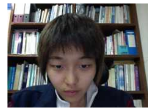
(라) (다)의 카메라 시점 영상