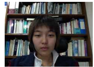
(나) (가)의 카메라 영상