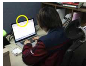
(다) 고개를 기울인 자세