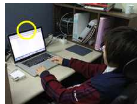
(마) 몸을 뒤로 젖힌 자세