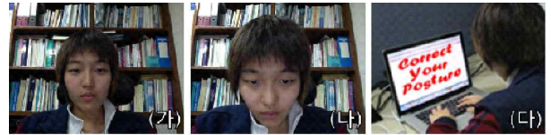
그림3. 샘플 데이터의 자세 측정과 판단. (가) 초기화 자세. (나) 고개를 숙인 자세. (다) (나)의 자세를 한 사용자의 경고화면.

다고 판단될 때에는 사용자에게 눈에 띄는 이미지와 사운드를 통해 경고 메시지를 통해 전달한다. 이 과정을 실시간으로 반복하기보다 10분을 주기로 한 번씩 체크를 하면 보다 효과적인 자극을 줄 수 있다.