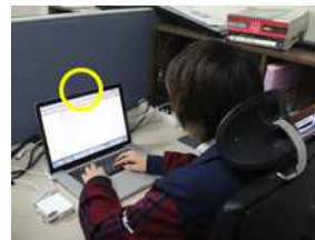
(가) 올바른 자세

본 논문에서 제안하는 시스템은 크게 초기화 단계와 자세 판단 단계로 나눌 수 있다. 초기화 영상은 입력받은 영상을 통해 자세를 판단