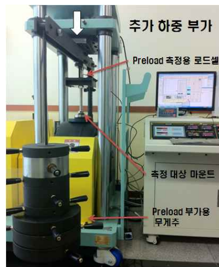
Fig. 1 Experimental apparatus for stiffness measurement under pre-load condition

마운트의 경우, 항상 장비의 자체 하중에 의하여 pre-load가 가해진 상태에서 사용되게 되므로 pre-load 값에 따른 마운트의 강성 값에 대하여 확인이 필요하다. Fig. 1은 pre-load 부가 하에 강성측정이 가능한 강성측정 실험 장치를 나타낸다. 그림에서 보는 바와 같이, 무게 추를 이용하여 pre-load 설정 값의 변경이 가능하며 pre-load가 가해진 상태에서 추가적으로 상부에서 유압실린더를 이용하여 하중을 부가하여 이에 따른 변위를 측정이 가능한 시스템이다. pre-load는 최대 9,810 N까지 설정 가능하며 유압식 하중은 최대 20,000 N 까지 부가가 가능하다. 측정은 로드 셀을 이용하여 하중 측정, LVDT (Linear Variable Differential Transformer)를 이용한 변위측정을 행하게 된다. 실험은 pre-load를 고려하여 마운트의 허용하중 내에서 추가로 하중을 부가하였다.