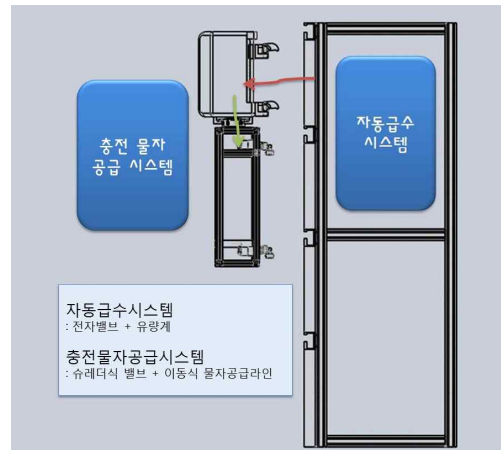
Fig. 1 Composition of Intelligent Electric Valve System

은 양의 물자를 필요로 하게 된다. 필요 물자를 로봇에 모두 적재하면 로봇의 하중 증가에 따라 외벽에 집중 하중을 가하게 되어 안전성에 문제를 일으키게 된다. 또한 유지관리를 통해 외벽을 보존한다는 기존의 목적에 위배되는 시스템이 도출된다. 이러한 문제점의 개선 사항으로 물자공급시스템을 두 개의 parts로 나누어 Intelligent Electric Valve System을 통해 건물로부터 Docking Station이 탑재된 수직 로봇으로 물자를 전달하여 충전하는 자동급수시스템과 Docking Station으로부터 작업을 수행하는 수평로봇으로 충전된 물자를 공급하는 충전물자공급시스템으로 구성되어 있다.