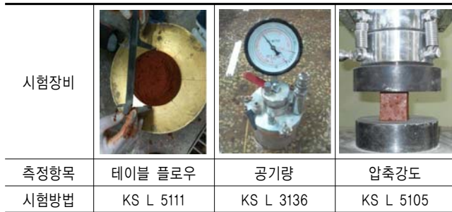
표 3. 저탄소 무기결합재 모르타르의 시험항목 및 방법