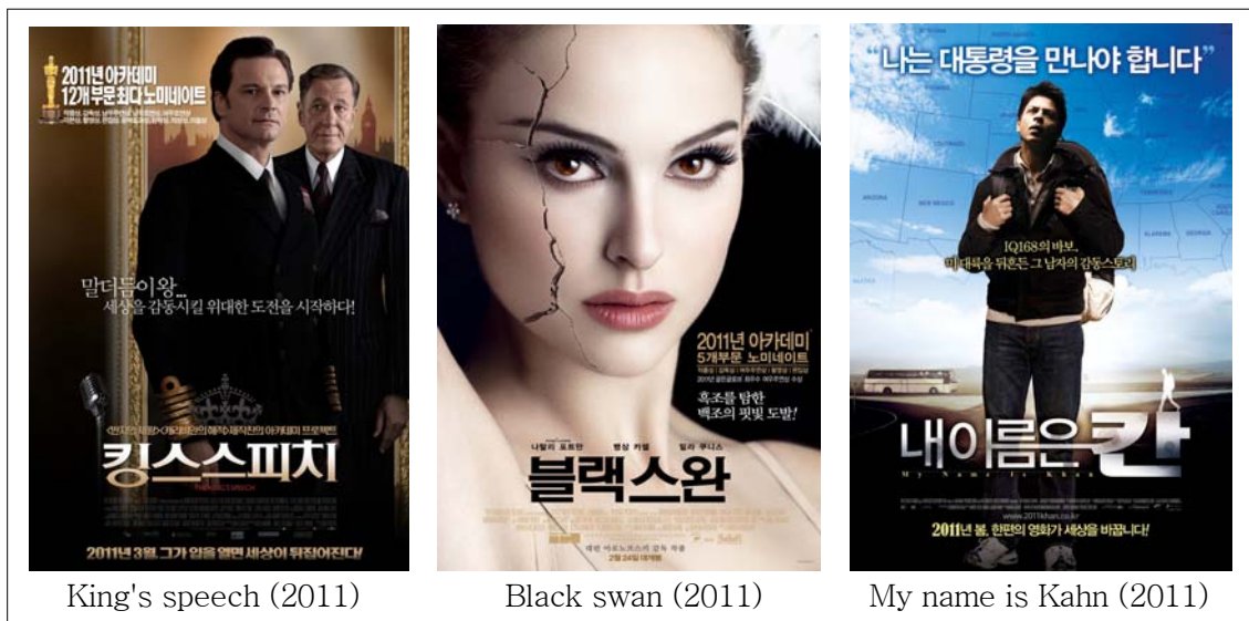
<Figure 3> Posters of movies was screened in 2011

무관심한 부모는 아동의 생활에 투자해야하는 시간과 힘을 최소화한다. 매우 자기중심적인 경향이 있으며 가정생활을 자신의 요구와 필요에 따라 구성해간다. 아동의 요구를 무시하거나 늦게 반응한다. 아동은 거의 지도받지 못하고 훈육에 무책임하다. 무관심한 가정의 아동은 더욱 충동적이고 다른 사람을 배려하지 않으며 의무를 수행하지 않게 된다.