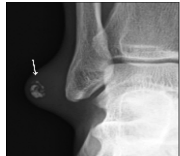
Fig. 1. 내원시 시행한 단순 방사선 사진

질문 2) 내원시 시행한 MRI를 보고 진단할수 있는 질환명과 함께 감별진단 할 수 있는 것은 어떤 것이 있을까요?