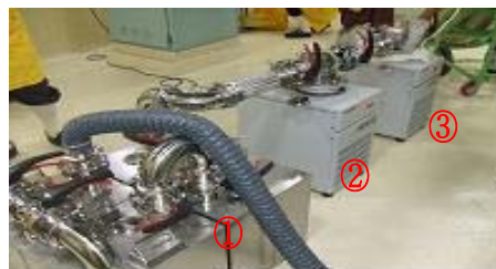
그림 1. Equipment Appearance

불활성기체는 그 물리/화학적 안정성으로 인하여 제거가 매우 어렵다. 원자력발전소에서 사용하는 기체방사성폐기물 처리계통(GRS)에서는 Charcoal Delay Bed에서 물리적인 흡/탈착을 반복시켜 이동속도를 지연시키고 자연붕괴를 이용하여 기체 폐기물을 처리한다. 동 계통은 핵연료 결함이 없는 정상 운전 및 계획예방정비기간 동안 발생하는 불활성기체는 정상적으로 처리(정상 처리량 : 2.5 cfm)가 가능하다. 그러나 핵연료 결함이 발생될 경우에는 통상적으로 정상 운전 대비 약 100배 이상의 불활성기체가 발생되는 것으로 국내·외 적으로 보고되고 있으며, 이와 같은 발생량을 처리하기 위해서는 별도의 대용량의 활성탄이 필요하다.