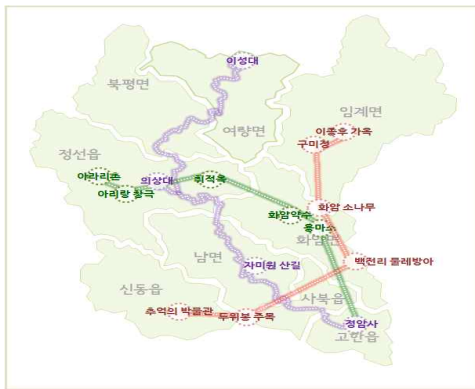
▶▶ 그림 1. 전통문화 관광네트워크

본 연구에서 제시한 학습형 관광네트워크는 초·중·고등학교 학생들을 대거 유치할 수 있음은 물론 가족단위 관광객이나 관련 동호회 단위의 방문객을 유치할 수 있으며, 지역 농장 및 체험마을 등과 연계가 가능하다는 장점을 지니고 있다.