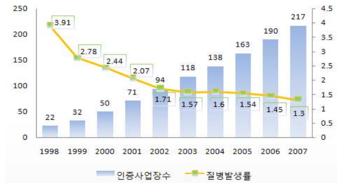
[그림 3] VPP 인증사업장 수 및 업무상 재해발생률

1998년 이후 GE의 OSHA 자율안전보건프로그램(VPP)과 GE 자체의 Global Star Program 인증 사업장수 및 근로자 100명당 업무상사고 및 질병 발생을 추이는 [그림 3]과 같다.