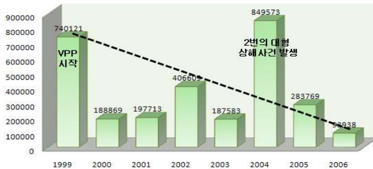
[그림 2] 연별 근로자 보상비용

이후 2006년에는 근로자보상비용은 94,000달러로 감소했다. 이 근로자 보상비용의 감소는 자율안전관리프로그램(VPP)가 상해나 질병을 줄이는데 그 역할을 하고 있다는 것이다. [그림1] 은 1999년부터 2006년까지 근로자보상비용이 얼마나 절약되고 있는지를 보여주고 있다.