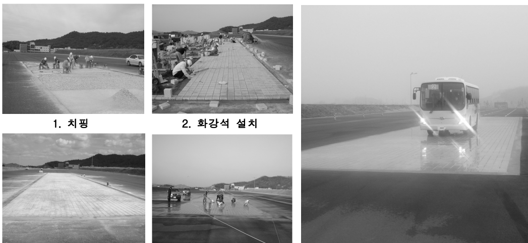
3. 테두리 콘크리트 타설