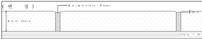
그림 2. 저마찰로 시공 단면도

시공법의 착안점은 콘크리트와 화강석간의 강한 부착원리를 활용하여, Base Concrete층(20cm) 위에 치핑처리 후 몰탈층(20mm), 화강석, 줄눈을 일체화시킨 것이다. 또한 강도를 증대시키기 위해 시공성을 고려하여 블록의 두께를 60mm로 최적화하였다.