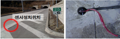
그림 1. 온도센서 설치

본 연구에서는 그림1과 같이 콘크리트 포장체의 깊이별 온도를 측정하기 위하여 동해고속도로 내 ○○터널에 위치한 상습결빙구간에 온도센서를 설치하였으며, 자세한 내역은 표1과 같다. 또한, 계측기간에 대한 기상청 일평균기온 및 강수량 자료와 비교평가 하였다.