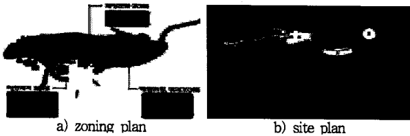
Fig. 1 Planning of floating island resort

플로팅 아일랜드 리조트 조성 후보지 중 해운대(광안리)해수욕장 해상을 대상으로 기본계획을 실시하였다.