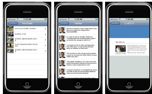
그림 6. 구현결과

그림6은 아이폰 기반의 학교홍보어플리케이션을 개발한 결과 화면이다. 학교 홍보를 위한 YouTube 비디오 제공, 트위터, 홈페이지를 제공하고 있다.