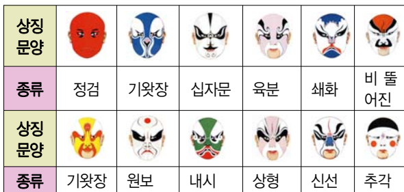
표 3. 문양 재해석

본 연구는 경극의 색채 및 형태의 상징 의미를 풀이하여 분석한다. 모든 검보는 제각각 특별한 의미가 있다. 기호학으로부터 출발하여, 과장된 얼굴 형상이 필요하다면 모두 간단히 그려낼 수가 있다. 단순화 표현 따라 문양을 재해석하여 시각화 작품을 표3에 나타내었다. 본 논문의 의의는 중국 전통경극의 집중적 연구의 결과 추출을 통해 앞으로 한국의 유사 동래탈춤과 비교하는 연구의 귀중한 사료로 예측되기에 본 연구를 진행하였다.