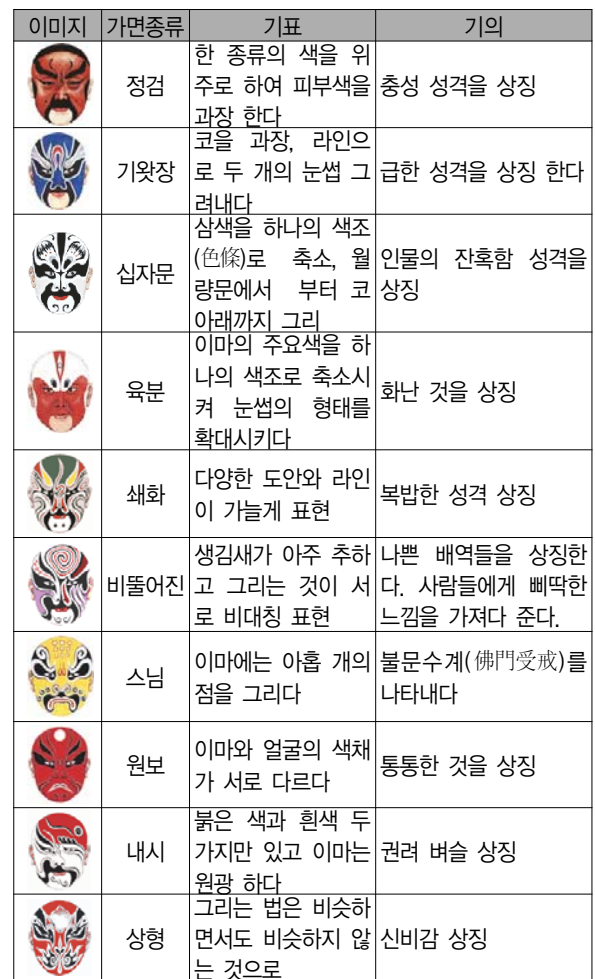
표 2. 이미지 기표와 기의 따르는 연구자분석

본 논문에서 연구자가 소쉬르의 기호학 연구를 적용하여 기표와 기의 있는 따라 다양한 표현 형태로 나타나는 12가지의 가면종류가 어떻게 의미가 형성되는지를 분석할 수 있었다.