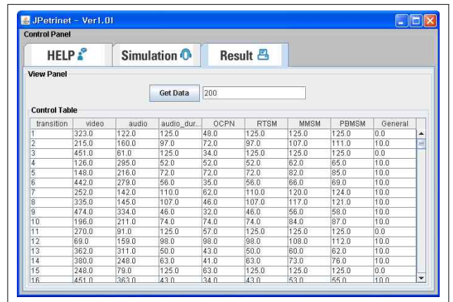
[그림 2] 시뮬레이션 인터페이스

[그림1]은 멀티미디어 동기화 모델의 시뮬레이션 인터페이스 첫 번째 화면이고, [그림 2]은 시뮬레이션 결과를 볼 수 있는 화면이다. 이전에 MDB에 저장해 놓은 모든 데이터들을 불러들여 결과를 볼 수 있다.