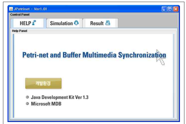
[그림 1] 시뮬레이션 인터페이스

시뮬레이션 환경은 Ethernet상의 WAN 환경으로 가정하였다. 각각의 패킷에 대한 적절한 작업을 수행하기 위해서 실제 시뮬레이션에 사용된 정보는 포하송 분포로 산출하여 네트워크 지연 시간을 두 가지 미디어에 똑같이 적용하였다.