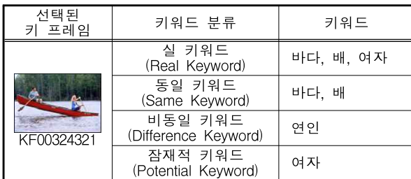
[표 1] 키 프레임 선택 후 키워드 분류

각 키 프레임들은 기본 주석 이외의 인텍싱 에이전트에 의해 자동으로 갱신된 1개 이상의 주석을 가지고 있다. 예를 들어, 사용자가 '바다', '배', '여자'라는 키워드로 질의한 결과 그림 3과 같이 여러 개의 키 프레임들이 검색되었고 그 중 사용자가 키 프레임 ID가 'KF00324321'인 키 프레임 이미지를 선택했다면, 표 1과 같은 키워드 분류가 시작된다. 키워드 분류가 이루어지면 인텍싱 에이전트에 주석 자동 갱신을 위한 동일 키워드와 비동일 키워드의 가중치 계산이 식 1과 식 2에 의해 표 2와 같이 이루어진다.