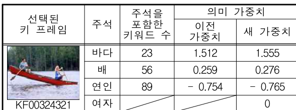
[표 2] 자동 주석 갱신 결과

표 2에 나타나듯이 실 키워드인 '바다', '배', '여자' 중에 '바다'와 '배'의 의미 가중치는 제안하는 동일 키워드에 대한 의미 가중치 계산에 의해 값이