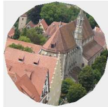
그림 5. 본 논문에서 제공한 정16각형의 형태로 서버 이미지를 추출한 것이다. 서버 이미지가 가지는 다각형의 각, 변의 개수가 많아질수록, 서버 이미지를 담고 있는 다각형은 서버 이미지 추출 시 기본이 되는 원을 형태를 가지게 된다. 즉, 점점 원의 넓이와 다각형의 넓이가 비슷한 값을 가지게 된다.

그림 3에서 그래프는 본 논문에서 제안한 시스템의 결과를 나타내고 있다. 그림 3의 그래프는 표 2의 값을 토대로 나타내었다. 실험의 결과는 예상했던바와 같이 정삼각형에서 정다각형으로 진화 또는 변, 각의 개수가 증가할수록 성공률이 낮아지는 것을 알 수 있다. 하지만 그림 3에서 나타나는 그래프의 값이 원의 넓이에 따라서 각각 다른 층을 가져야 하나 원의 값이 150과 100에서 두 개의 그래프 값이 약간 교차되는 것을 발견 하였으나, 이와 같은 실험의 횟수를 더 많이 늘리고, 실험자를