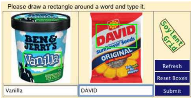
그림 2. 시스템 [9]의 CAPTCHA 시스템을 보여주고 있다. 시스템 [9]는 이미지 내에 존재하는 텍스트 영역을 사용자가 직접 지정하여 지정된 영역 내에 존재하는 텍스트를 입력하여 사용자 인증을 거치게 되는 시스템이다.

제시하여 사용자 인증을 거치게 되는 것이다. 시스템 [3] 은 총 12장의 고양이와 개의 사진을 제시한 후, 총 12장의 사진에서 고양이의 사진을 선택하면 사용자 인증을 거치게 되는 것이다. 시스템 [3] 에서는 개와 고양이의 색깔이 동일할 경우 머신 러닝을 통하여 통과할 수 없다고 하였으나, [5]에서 사용자는 30초 만에 82.7%로 통과할 수 있는 것으로 나타났다.