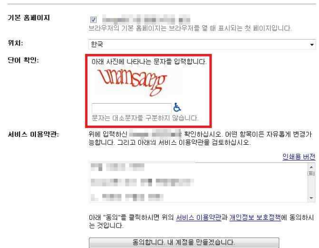
그림 1 우리가 포털사이트 가입 시 흔히 볼 수 있는 가입 양식이다. 하지만 우리는 본 그림에서 볼 수 있는 빨간 박스에 존재하는 텍스트로 이루어진 퍼즐을 볼 수 있다. 우리는 이와 같은 퍼즐을 통과해야지만 사이트에 가입할 수 있다.

정보화 시대의 도래로 인터넷의 많은 발달 및 보급이 이루어져 우리는 정보화 시대 및 인터넷 시대에 살고 있다. 또한 우리가 정보를 검색하고 정보를 획득하게 되는 매체가 인터넷으로 차지되는 비율이 점점 증가하고 있는 추