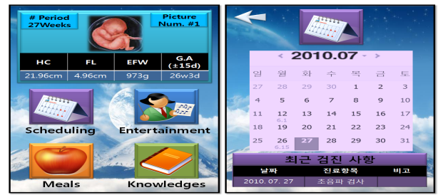
(그림 5) 구현 화면

스마트폰의 화면에 보이는 화면구성은 그림 7과 같다. 메인화면은 화면상단은 임신주기 기간에 따라 태아가 성장하는 모습을 보여주는 태아 이모티콘을 넣었고, 현재 주기와 태아 상태 이력이 나오게 된다. 하단은 애플리케이션에서 제공하는 4가지 기능인 스케줄링, 엔터테인먼트, 식단, 임신부 지식에 버튼 아이콘으로 구성하였다.