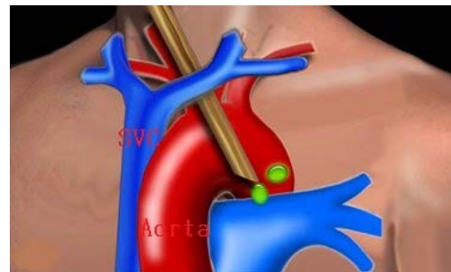
Figure 4. Innominate artery와 left common

림프절 생검을 위한 종격동경 수술은 일회 시행하기도 하지만, 필요에 따라 이차 종격동경 수술이 필요하기도 하다 17,18) . 재종격동경 수술의 적응증으로는 이전 종격동경 수술이 부적절했던 경우, metachronous second primary lung cancer, 재발성 폐암, lung cancer occurring after unrelated disease(ex, lymphoma, sarcoidosis,