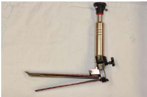
Figure2. Video-assisted Mediastinoscopy, Wolf Com.