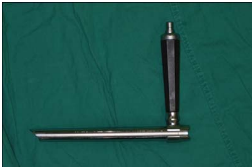
Figure1. Conventional mediastinoscopy

적인 비디오 종격동경(Wolf Co., Fig. 2)을 개발한 이후 수술 영상 장비와 수술 기구의 발전은 종격동경 수술이 새로운 도약을 할 수 있는 토대를 제공하였다. 1994년 Sortini 등이 비디오 종격동경을 임상에 사용하면서 비디오 종격동경 수술은 진단, 치료의 다양한 영역에 걸쳐 확산되었다. 여기에서는 비디오 종격동경 수술에 관한 전반적인 고찰을 하고자 한다.